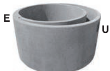
An. terminale sedim.